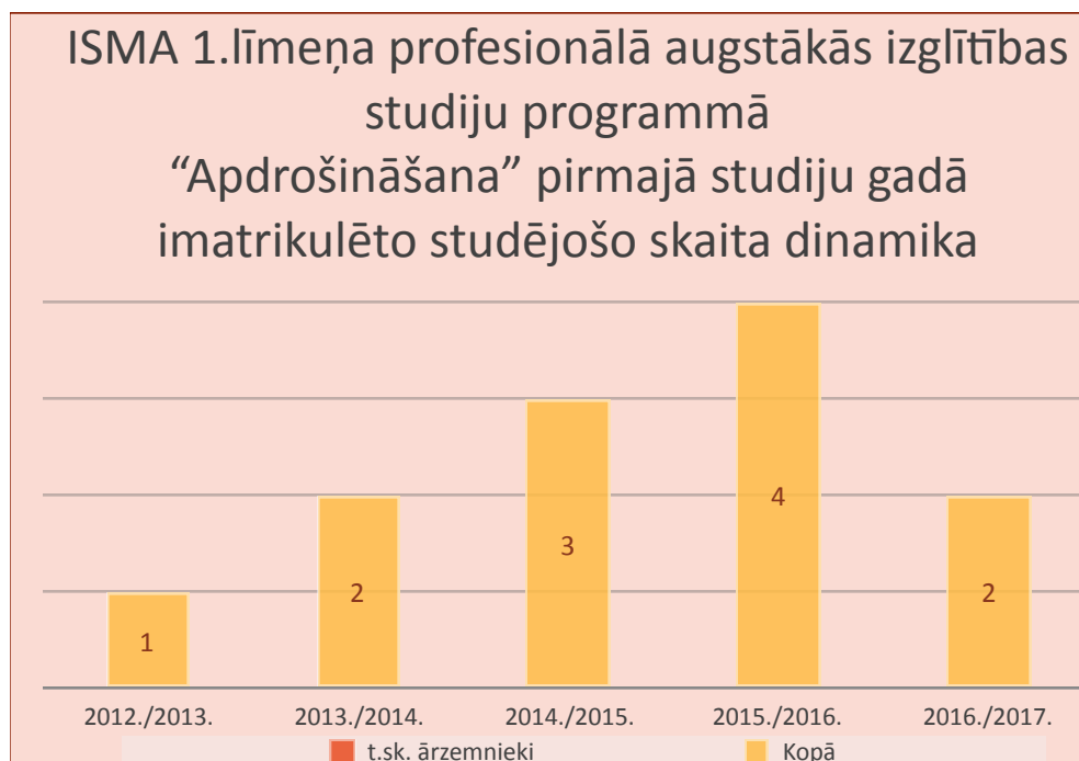
8.2. att. Pirmajā studiju gadā imatrikulēto studējošo skaits pārskata periodā no 2012./2013. līdz 2016./2017.