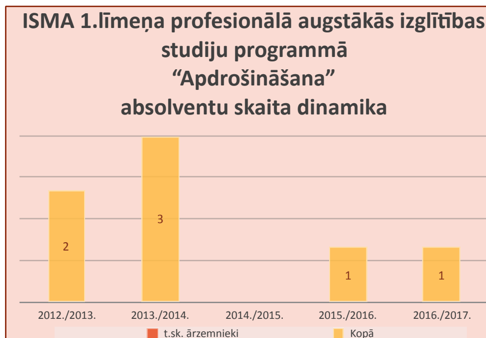
8.3. att. Absolventu skaits pārskata periodā no 2012./2013. līdz 2016./2017.